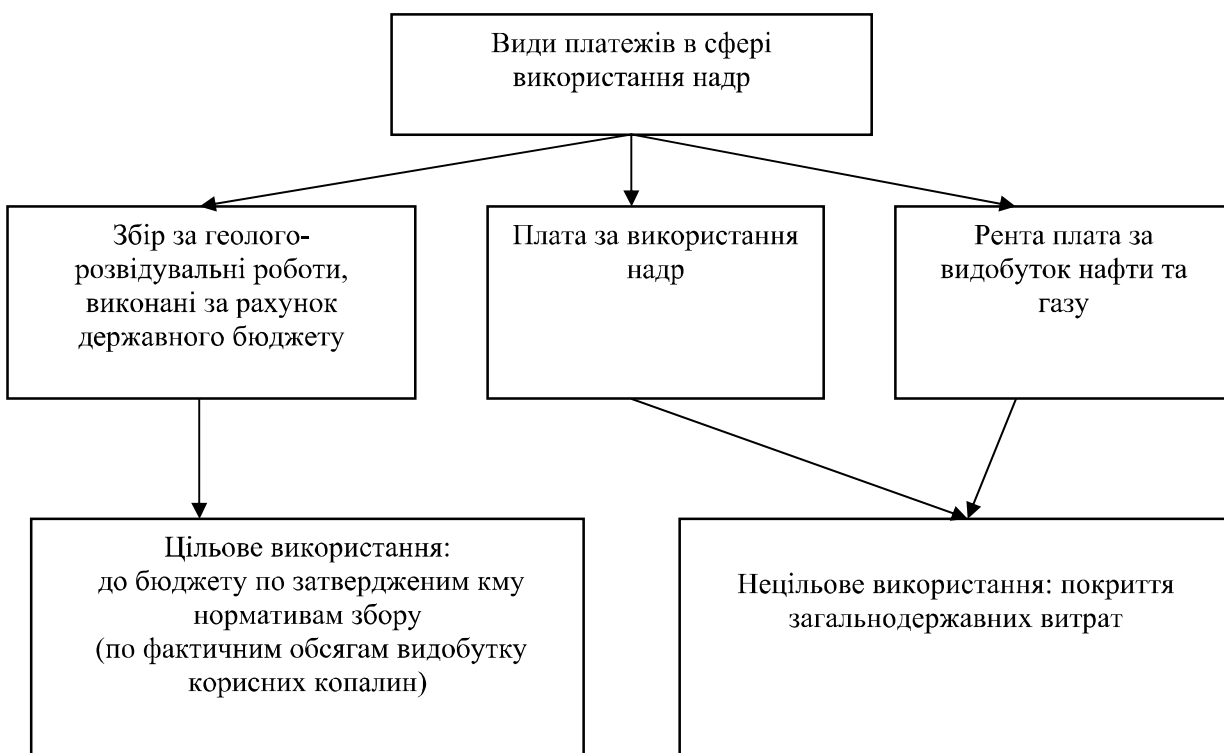
Рисунок 1 – Види платежів за надрокористування

Диференціація платежів має встановлюватися по видам корисних копалин незалежно від економічних показників експлуатації родовищ. Таким чином, підтверджується необхідність державного втручання і реформування економічного механізму надрокористування.