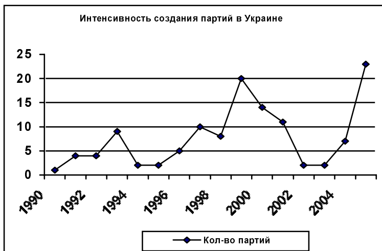
Диаграмма 1. Интенсивность создания партий в Украине (1990-2005 гг.)

О формате партийной системы нельзя судить только по количеству легализованных Минюстом партий. Более верно параметры партийной системы измеряются участием партий в выборах. Сводную картину участия партий в парламентских выборах 1994-2006 гг. мы представили в Таблице 9 .