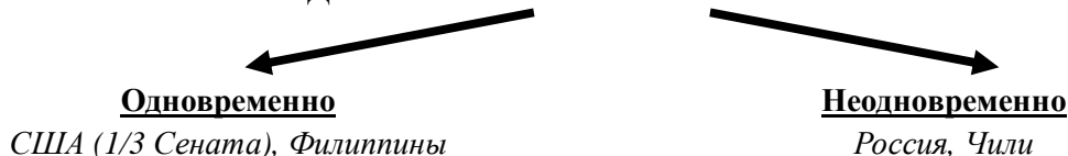
Рис. 3. Классификация президентских и парламентских выборов с точки зрения времени их проведения

Эффективное число партий (кандидатов) определяется по формуле 2