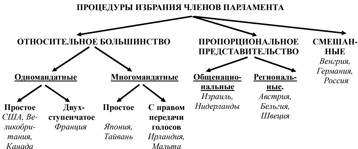
Рис. 2. Классификация процедур избрания членов парламента

Президентские выборы могут проходить вместе с парламентскими или независимо от них (см. рис. 3).