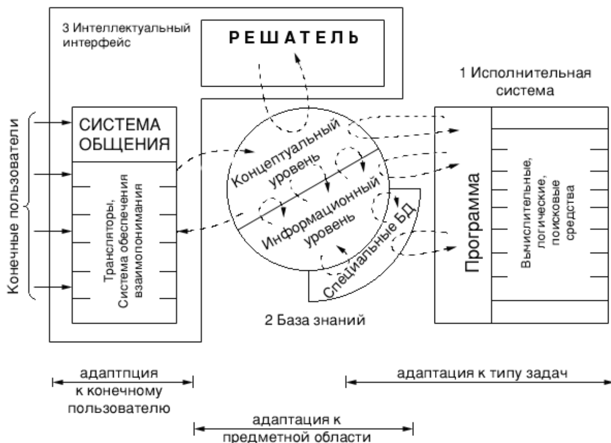
Рисунок 1 - Функциональная структура использования средств искусственного интеллекта

Наиболее успешными проектами по созданию электронных учебников являются те, которые базируются на использовании средств искусственного интеллекта. Функциональная структура использования средств искусственного интеллекта представлена на рисунке 1.