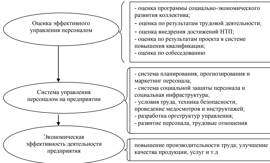
Рис. 2. Основные направления оценки эффективного управления персоналом на эффективность использования кадров предприятия и экономические результаты организации

2. Оформление и учет кадров: оформление и учет приема, увольнений, перемещений, информационное обеспечение системы управления персоналом, профориентация, обеспечение занятости.