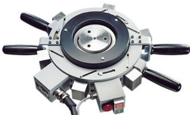
Рисунок 24 – Индукционные нагреватели EAZ для съема подшипников с нагревом [6]

масла в стяжной втулке также облегчает проведение съема подшипника. Масло под давлением разделяет сопряженные поверхности втулки и подшипника, а последующее навинчивание гайки выталкивает стяжную втулку.