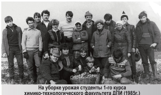
На уборке урожая студенты 1-го курса химико-технологического факультета ДПИ (1985г.)