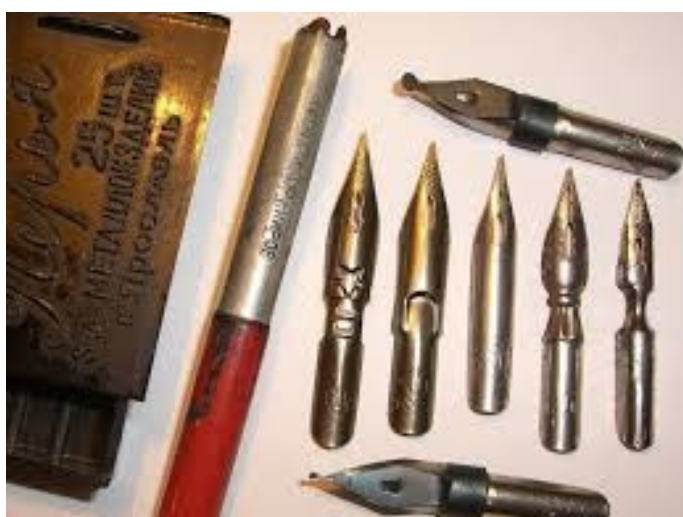
Ручка-вставочка и перья к ней