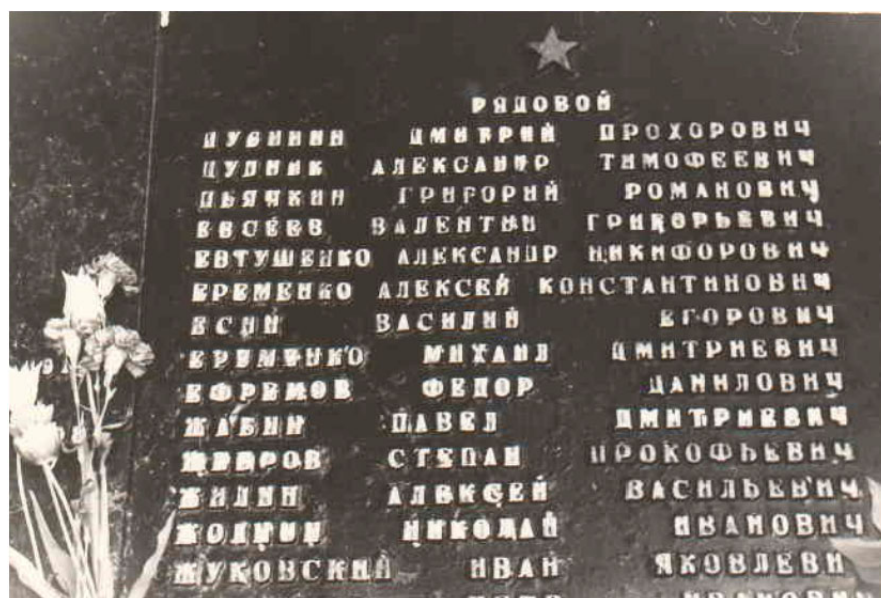
Памятная плита, с. Александровка. 1975 ? г.