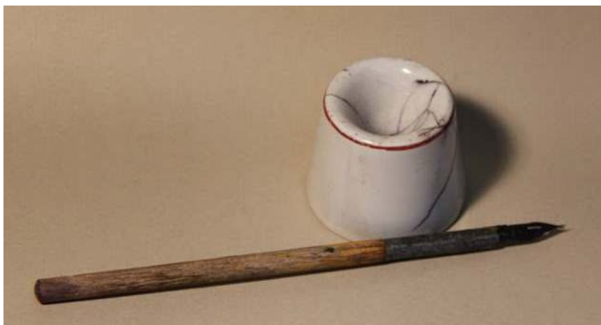
Ручка и чернильница-непроливайка