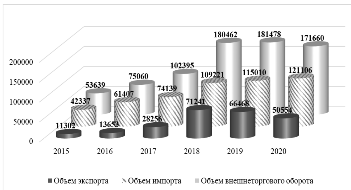
Рисунок 1 – Динамика внешней торговли ДНР, 2015–2020 гг., млн руб. [9–13]

В современных условиях внешнеэкономическая деятельность ДНР затруднена множеством факторов, которые негативно влияют на развитие международных связей молодого государства. Но уже в 2016 г. внешнеэкономическая деятельность демонстрирует положительную динамику (рисунок 1).