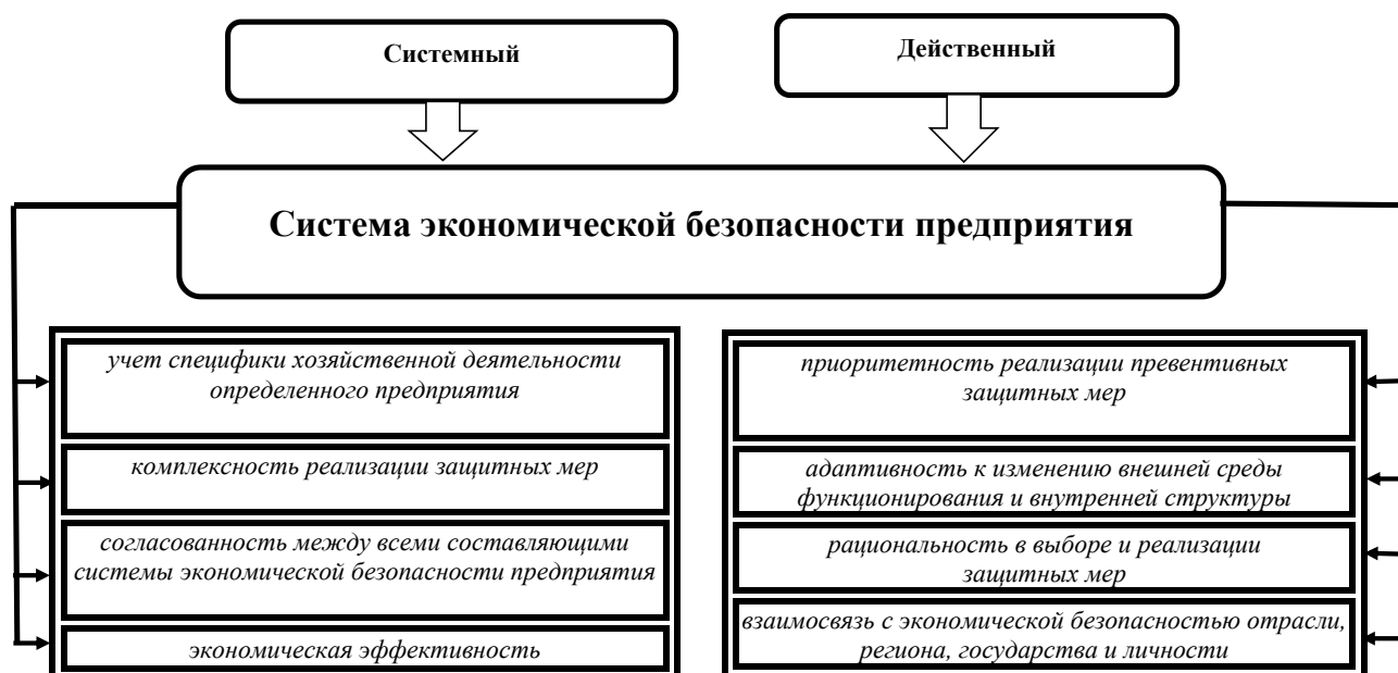
Рис 1. Принципы формирования системы экономической безопасности предприятия

Несмотря на то, что потребность обеспечения необходимого уровня экономической безопасности предприятия проявляется как на микро-, так и на макроуровне, нужно признать, что без приложения максимальных усилий со стороны каждого субъекта хозяйствования достичь этой цели невозможно, поэтому крайне актуальным становится формирование структурированной системы экономической безопасности. Указанный процесс – это обеспечение устойчивости предприятия через адекватную реакцию на изменение среды функционирования для формирования безопасных условий достижения интересов. Цель системы экономической безопасности предприятия, функционирующего в экономическом секторе ДНР, можно определить, как разработку и реализацию совокупности мер для обеспечения устойчивости предприятия через сохранение равновесного состояния и, при необходимости, его адаптации к динамическим изменениям в среде функционирования путем формирования безопасных условий для эффективного использования имеющихся ресурсов, а также достижения интересов [3, с. 9].