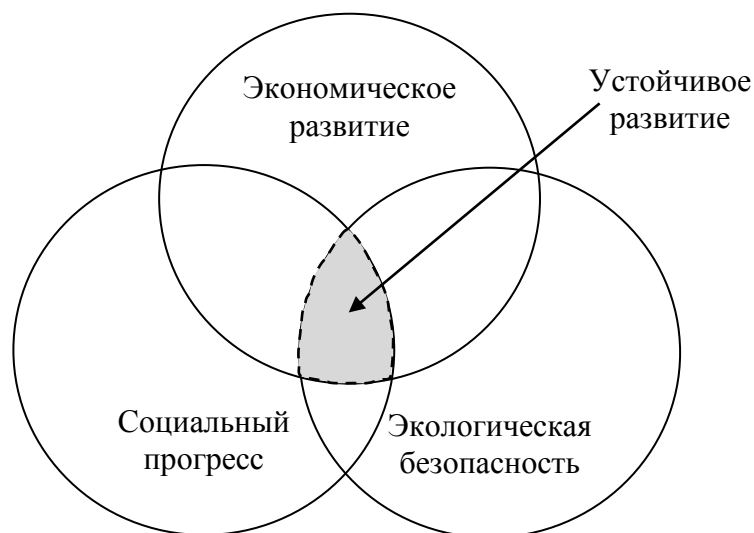
Рисунок 1 – Графическое изображение концепции устойчивого развития (разработано автором на основе [34])

Следовательно, перманентный учет принципов Концепции устойчивого развития должен быть положен в основу грамотной государственной политики ДНР в социально-экономической сфере. Ее реализация должна осуществляться на основе комплексного механизма управления (рисунок 2).