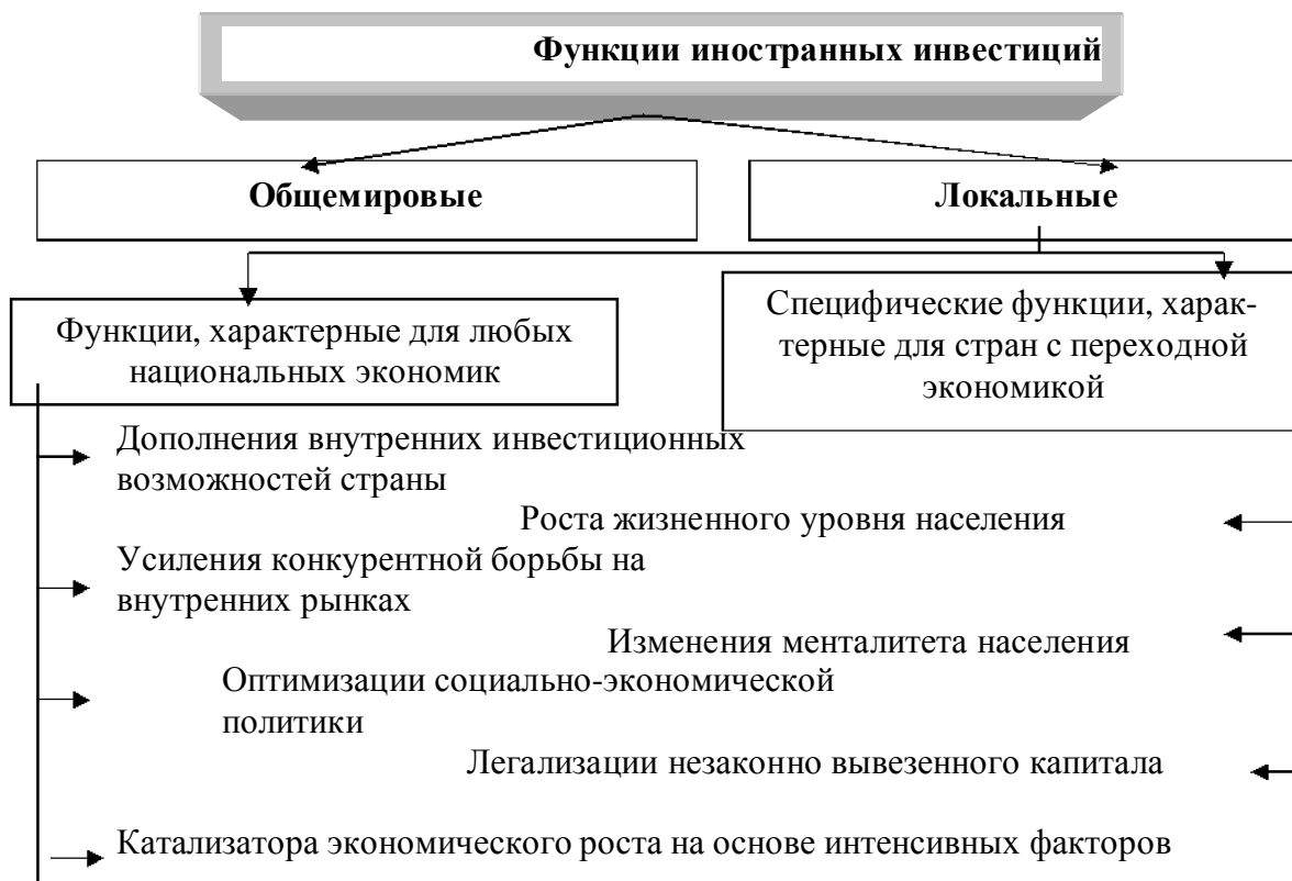
Рис.1. Функции иностранных инвестиций

Для Украины отрицательным фактором является изменение целей привлечения иностранных инвестиций (рис.2). Иностранный капитал, в значительной мере, привлекается для осуществления импортозамещающей индустриализации, то есть для того, чтобы снизить свою зависимость от передо-