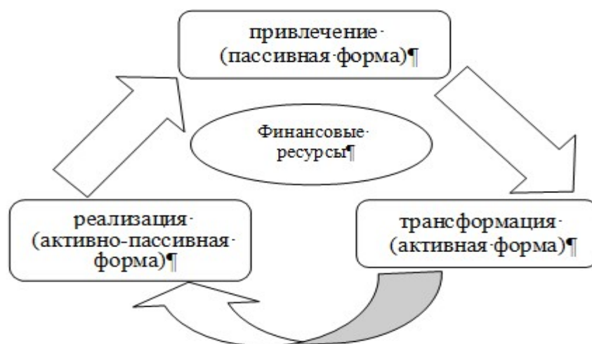
Рисунок 2 – Стадии трансформации финансовых ресурсов предприятия

Особенно важно отметить, что каждая стадия трансформации финансовых ресурсов (привлечение, трансформация и реализация) должны быть направлены на достижение одной из главных целей функционирования предприятия – увеличение рыночной стоимости предприятия. Значимым является гармоничное распределение требуемого объема финансовых ресурсов для выполнения заданной производственной программы и обеспечения воспроизводства.