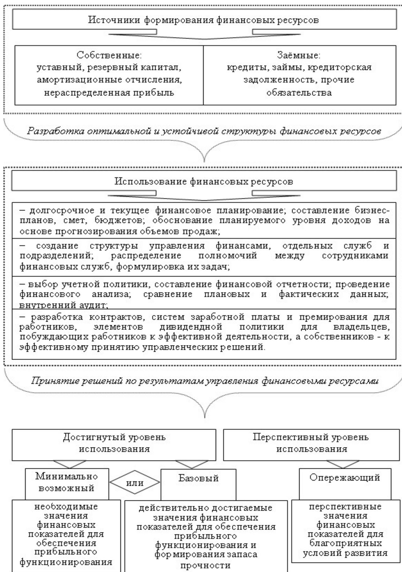
Рисунок 3 – Схема управления финансовыми ресурсами предприятия