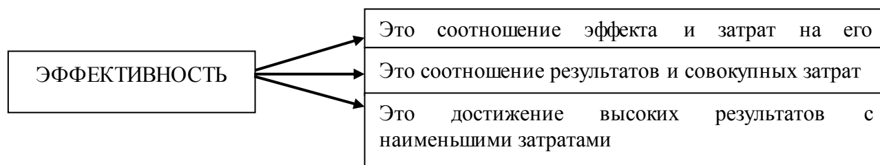
Рисунок 1 – Сущностная характеристика и измерение эффективности

Одно из важных мест в экономической науке и практике занимают категории «эффект» и «эффективность». Эффект – это абсолютная величина, указывающая на достигнутый результат процесса (результатами могут быть размер готовой продукции в натуральном выражении или цена, прибыль). Огромный масштаб этих результатов не позволяет делать выводы об эффективности или неэффективности предприятия, поскольку неизвестно, какой ценой были достигнуты эти результаты. Таким образом, чтобы получить объективную оценку деятельности, необходимо учитывать затраты, которые повлияли на конечные результаты деятельности предприятия. Исходя из этого, можно сказать, что эффективность предприятия – это комплексная оценка конечных эффектов использования основных и оборотных средств, трудовых, финансовых ресурсов и нематериальных активов за период. Эффективность сочетает в себе как полученный эффект, так и ресурсы, затраченные на его достижение. Основные характеристики и измерение эффективности производства показаны на рисунке 1 [1].