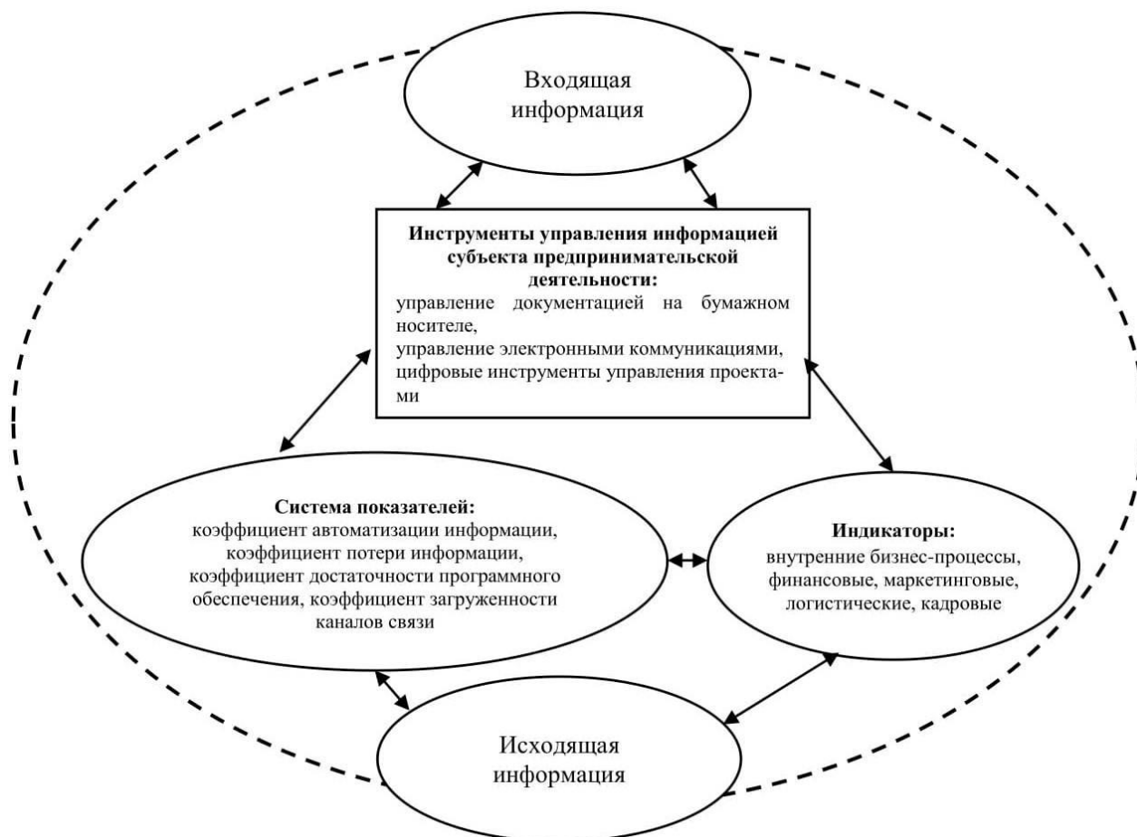
Рисунок 2 – Взаимосвязь составляющих информационно-аналитического обеспечения экономической безопасности субъекта предпринимательской деятельности

При таких условиях организация информационного обеспечения деятельности субъектов предпринимательства должна иметь комплексный характер и осуществляться в различных сферах информационной среды. Информационные потребности большинства предприятий примерно одинаковы, поэтому информационное обеспечение должно отвечать следующим требованиям [2, с. 86]: