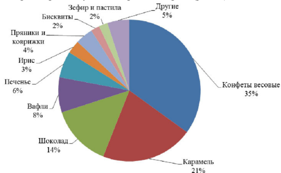
Рисунок 3 - Структура экспорта кондитерских изделий по категориям продукта в 2018 году

которых, составляет 5%, относятся конфеты в коробках, халва, новогодние подарки, драже, сухие завтраки и торты (рис. 3).