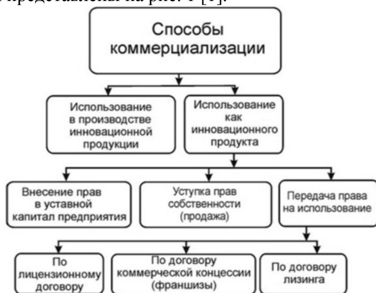
Рис. 1. Структура способов коммерциализации ОИС

Способы коммерциализации объектов интеллектуальной собственности представлены на рис. 1 [1].