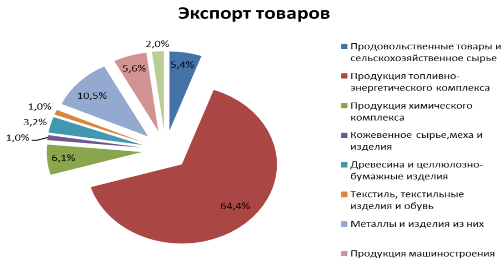
Рис. 1. Товарная структура экспорта Российской Федерации в 2018 г. [4]

Общая ситуация в экспортной специализации России, которая является национальным экспортером отдельных товаров (продукция топливно-энергетического комплекса, продукция химического комплекса и продовольственные товары). Поэтому дальнейшее увеличение объема экспорта должно сопровождаться эффективными структурными изменениями (рис. 1).