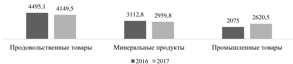
Рис. 2. Структура импорта в Абхазию из Российской Федерации (млн. руб.)

В силу своего географического положения, Абхазия обладает значительными природными рекреационными ресурсами и получает доход от туризма. Однако несмотря на привлекательность данной республики в качестве рекреационной зоны, отдых здесь пользуется сомнительной репутацией среди туристов в силу сложной криминогенной обстановки в стране, частых эпидемических вспышек ротавирусных и прочих кишечных инфекций, спекулятивного отношения местного населения к туристам и неразвитости туристической инфраструктуры. В 2017 году государство Абхазия получило доход от туризма в размере 197 347,1 тыс. руб., что на 58% меньше от ожидаемого, а в 2016 году доход от курортной и туристической деятельности 400 299,6 тыс. руб., что на 202% больше по сравнению с 2017 годом [1]. Дополнительно осложнили курортный сезон 2017 года рост стоимости авиаперевозок из городов России в направлении г. Сочи, переориентация авиаперевозчиков на выполнение чартерных программ на турецком направлении, сохраняющиеся сложности перехода российско-абхазской госграницы, рост популярности и продвижение Крыма на российском рынке туристических услуг.