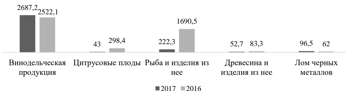
Рис. 1. Структура экспорта из Абхазии в Российскую Федерацию (млн. руб.)

Основу экспорта Абхазии составляет продукция агропромышленного комплекса – 93,9% в 2017 году (винодельческие изделия, цитрусовые, рыбная мука, рыбий жир и рыба), а основным рынком сбыта продукции является Российская Федерация, которая признала независимость данной республики. С учетом того, что агропромышленный комплекс приносит государству наибольший доход от внешнеэкономической деятельности, он часто подвержен изменениям рыночной конъюнктуры в Российской Федерации, влиянию погодных факторов, а также поражению плодов заболеваниями и вредителями, что сказывается на качестве и количестве продукции. На рис. 1 и 2 представлена информация об основных статьях экспорта и импорта Абхазии [1].