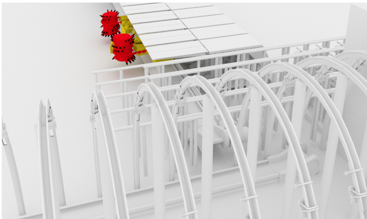
Рисунок 1 – Сопряжение лавы с откаточным штреком

Разработанные сценарии позволяют визуализировать во времени и пространстве работу в очистном и проходческом забое, имитировать процессы ремонта горных выработок (рис. 1, 2).