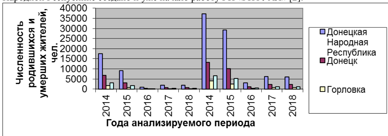
Рисунок 1 - Динамика естественного прироста населения ДНР в целом, а также городов: Донецк, Макеевка, Горловка (по данным ГУС ДНР) [3].

На основании распоряжения Главы Донецкой Народной Республики №21 от 09.02.2017 года «О создании Государственного предприятия «РИТУАЛ» в Донецкой Народной Республике создано и уже начало работу ГП «РИТУАЛ» [2].