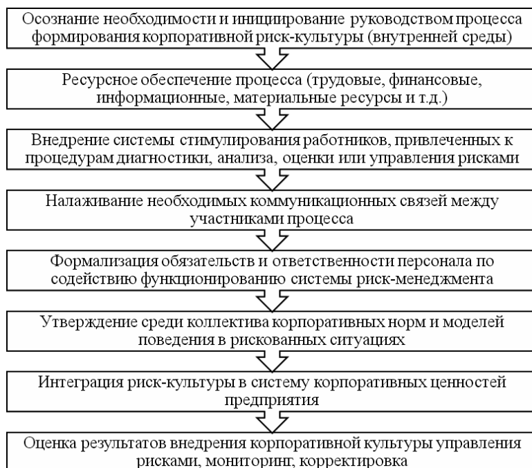
Рис. 2. Основные этапы процесса формирования корпоративной культуры риск-менеджмента

Основные этапы процесса формирования корпоративной культуры управления рисками деятельности предприятия отражены на рис. 2.