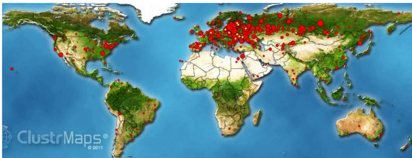
Рис. 2. Карта заходов на сайт Института Культуры ДонНТУ. Самый малый круг – до десяти человек в месяц из данного региона. Самый большой круг – более 1000 человек/месяц из этого города/местности.

Полагаем, что настал момент объединения на основе великого понятия Культуры (ведь именно по ней сегодня нанесен удар и проходит разделение), и каждый ВУЗ и профессор и просто творческий человек, не равнодушный к будущему своей страны, может найти место в институте культуры ДонНТУ. Многие страны мира заходят на сайт и смотрят видео-программы института культуры ДонНТУ (см. рис.2).