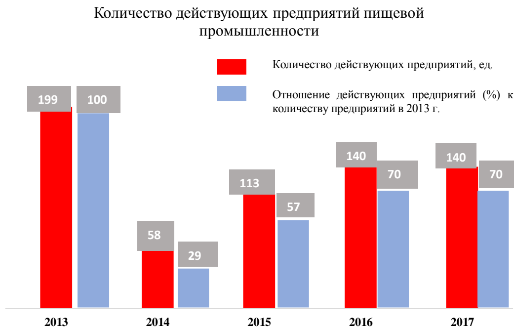
Рисунок 1 – Количество действующих предприятий пищевой промышленности

По состоянию на 1 января 2017 г., осуществляли хозяйственную деятельность 140 предприятий пищевой промышленности, а на 1 ноября 2017 г. их количество увеличилось на 6, что составило 4,3 %. Донецкий пивоваренный завод и компания «Винтерпром» – возобновили работу, а предприятия мясоперерабатывающей, ликероводочной, хлебобулочной отраслей и производства полуфабрикатов были открыты заново [5].