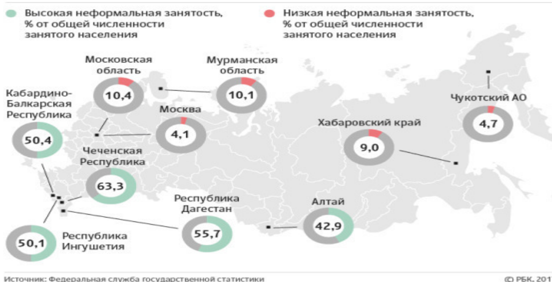
Рис. 2. Регионы с самой высокой и самой низкой неформальной занятостью

Внедряемые меры административного регулирования, включая безналичные расчеты, позволяют выявлять теневой сектор и создавать барьеры для его функционирования, однако они совершенно не стимулируют владельцев бизнеса выводить его из тени, попутно создавая трудности для тех, кто пока не в тени.