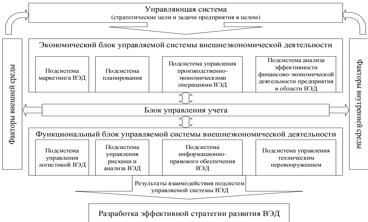
Рис. 2. Схема организации и взаимодействия подсистемы организационно-экономического механизма управления ВЭД

Главной предпосылкой высокоэффективной деятельности промышленного предприятия является хорошо продуманная и четко сформированная организационная и функциональная структура управления как всего предприятия, так и сферы внешнеэкономической деятельности в