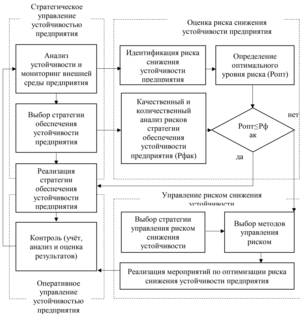
Рис. 2. Схема процесса управления устойчивостью с подсистемой управления риском

Такой подход обусловлен двойной реакцией стратегического управления на внешние изменения: долгосрочной и оперативной одновременно. Долгосрочная реакция заложена в стратегических планах, а оперативная – реализуется в режиме реального времени. Поэтому подсистема управления риском на предприятии должна предусматривать контроль и управление рисками как при принятии стратегических решений, так и при их реализации путем тактических и оперативных решений.