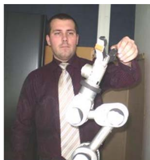
Figure 5 – Etude de l'interaction du bras robotique KATANA avec son environnement, à

Pour la période du stage du 1 janvier au 31 juillet 2010 il a réalisé une série des études expérimentales et théoriques et a validé le modèle du système électromécanique du robot ROBIAN au LISV. On a testé l'algorithme de compensation des déficiences se base sur la méthode de F.L. Lewis suppression des vibrations, qui utilise un neurone pour ajouter la correction à l'entrée du système en fonction de la vibration ; le critère de Lyapunov est utilisé pour l'adaptation des poids. Nous avons appliqué cette méthode pour supprimer les oscillations du genou en mesurant les oscillations angulaires avec les capteurs MEMS (un inclinomètre et un accéléromètre). On a bien approuvé expérimentalement que l'amplitude des oscillations articulaires parasites a notablement diminuée. Pour contrôler les oscillations dues à la compliance, après sa compensation, on envisage d'utiliser le neurone rythmique de Rowat-Selverstone qui permet de générer des oscillations de façon augmenter la stabilité et la vitesse de la marche du robot bipède ROBIAN.