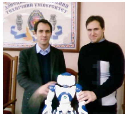
Figure 4 – Le robot humanoïde NAO (Aldebaran, France) lors la présentation à l'UNTD