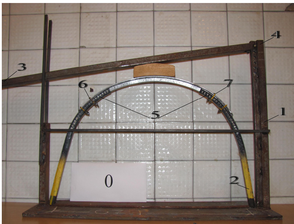
Рис. 2. Стенд для испытаний работоспособности арочной крепи: 1 – пространственная рама; 2 – модель трехзвенной крепи; 3 – нагрузочный рычаг; 4 – место крепления рычага к пространственной раме; 5 – калиброванная шкала в местах соединения несущих элементов крепи; 6 – замок (узел) №1; 7 – замок (узел) №2

В выработках пройденных вкрест простирания, а также по падению и восстанию пород (всего в 12% обследованных) преобладающие смещения контура, отличные от направления податливости, проявляются при расположении продольной оси выработок в диапазоне углов 30-60^{\circ} к линии простирания пород. Так, для оценки работоспособности арочной крепи, в зависимости от направления наибольших смещений, были проведены лабораторные исследования. Для проведения исследований был разработан и изготовлен специальный стенд (рис.2).