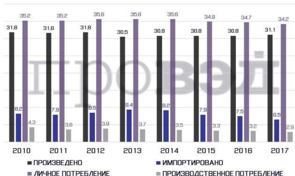
Рис. 1. Производство, импорт и потребление молока в РФ в 2010-2017 гг. (млн. тонн)

Современный рынок молока и молочной продукции РФ характеризуется ужесточением конкуренции, что объясняется, укреплением позиций интернациональных и российских производителей, ростом активности локальных предприятий, развивающих собственные торговые марки. Российский рынок молока в 2017 году развивался в условиях роста производства и снижения потребления, как следует из анализа, проведенного экспертами Института конъюнктуры аграрного рынка (ИКАР). По оценке ИКАР, объем производства молока в хозяйствах всех категорий в 2017 г. составил 31-31,1 млн тонн, что на 1% больше, чем в 2016 г. (рис. 1) [5].