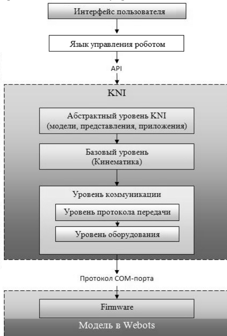
Рисунок 1 – Схема ПО программно-аппаратного комплекса управления роботами-манипуляторами фирмы Neuronics AG

Объектом исследования являлись робот-манипулятор Katana 5M180 (рис.1) и библиотека управления KNI 3.9.2.