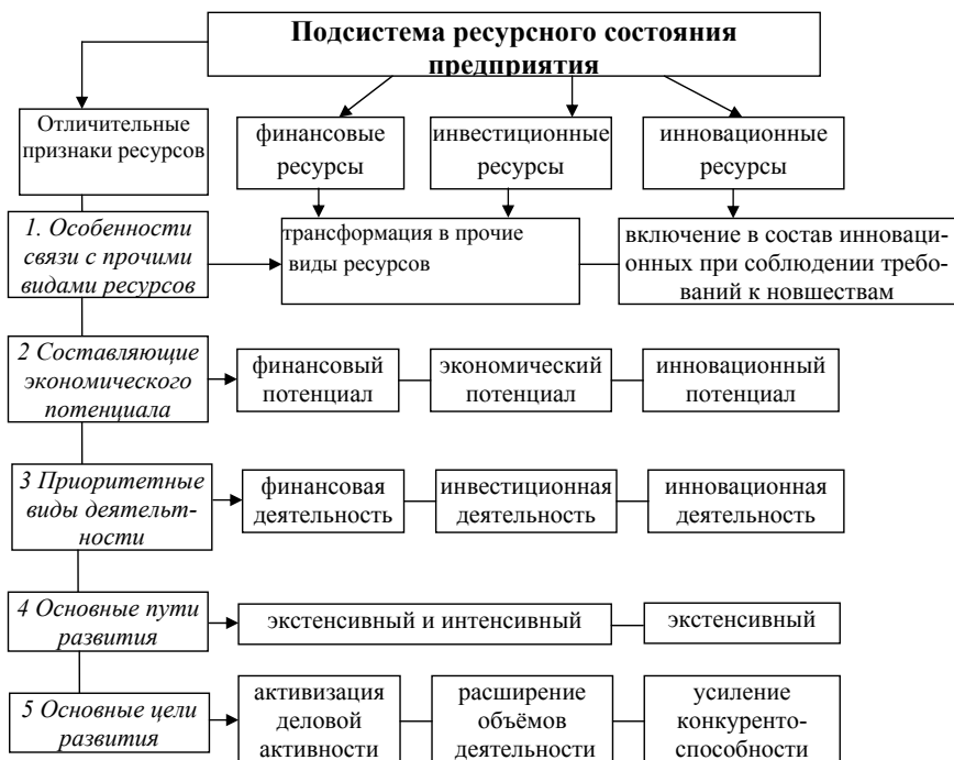
Рис. 1. Отличительные особенности ресурсов в подсистеме развития предприятия

К приведенным на рис. 1 отличительным признакам ресурсов следует добавить, что каждый из рассматриваемых видов ресурсов принимает активное участие на всех стадиях экономического развития предприятия. Роль данных видов ресурсов возрастает в период стабильного экономического положения в стране и в период оживления экономической конъюнктуры – посткризисный период, тогда как кризисные макроэкономические проявления препятствуют осуществлению не только инвестиционно-инновационных процессов, но и осуществлению текущего финансирования деятельности.