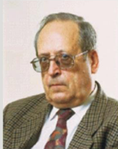
Рисунок № 4. В.М. Глушков был единственным ученым, который упорно сопротивлялся попыткам копирования устаревших технических решений, предлагая в качестве альтернативы самые совершенные на тот момент оригинальные решения в сфере информационных технологий. По словам А.П. Ершова, если бы не был прекращен выпуск машин серии МИР, то у нас в стране были бы самые лучшие персональные компьютеры в мире.

“...У России, как известно, есть две беды — дураки и дороги. В последнее время к ним прибавилась третья — дураки, которые указывают дороги...” Академик Д.С. Львов