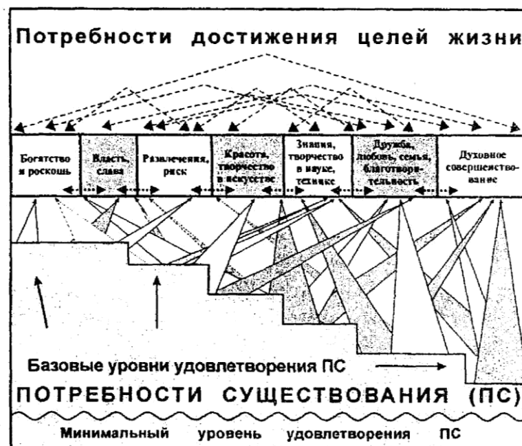
Рис. 3.1. Структура потребностей человека