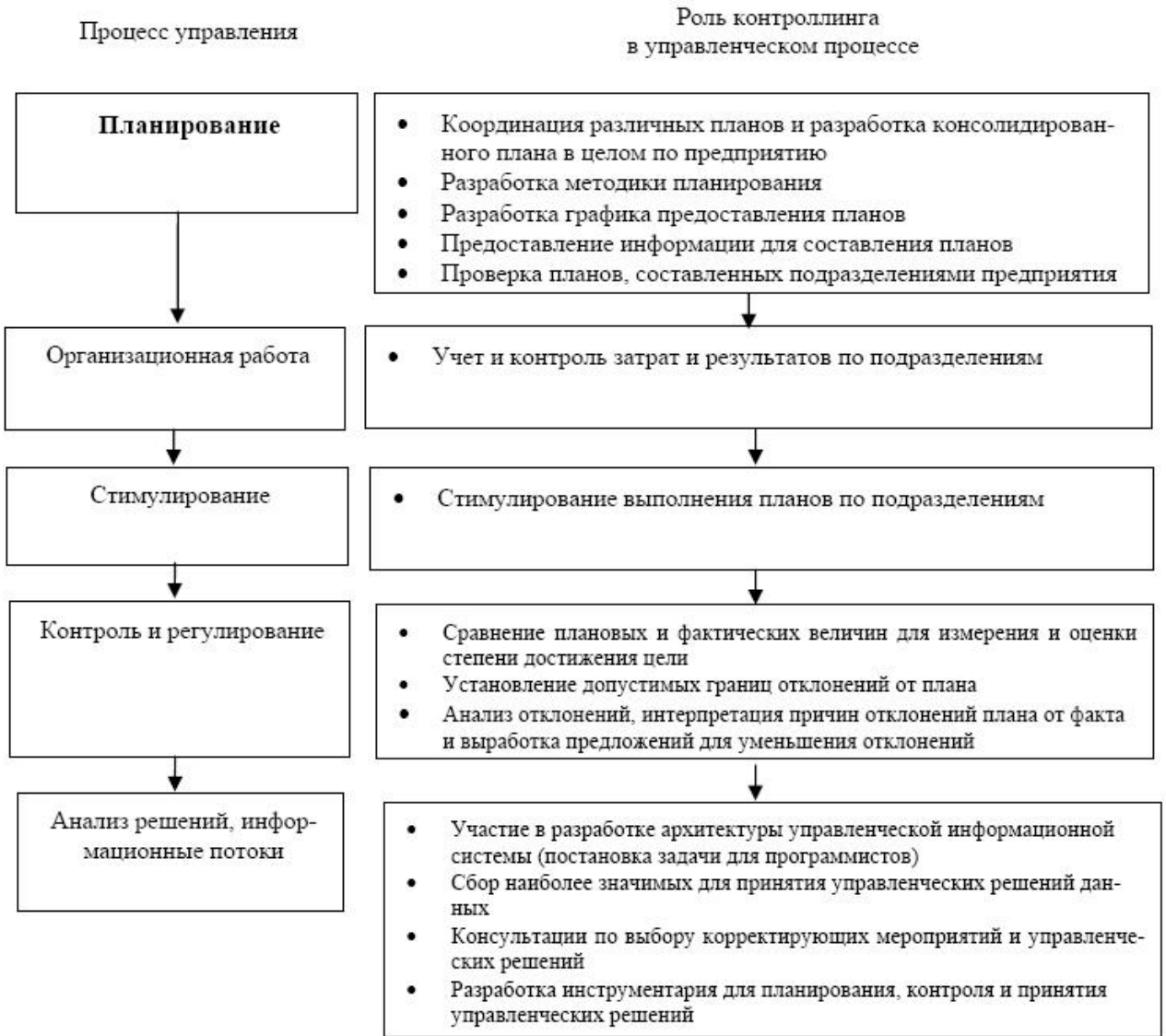
Рис 2. Роль контроллинга в различных управленческих процессах