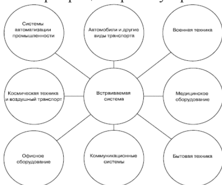
Рисунок 2 – Сферы применения встраиваемых систем К свойствам встраиваемых систем относят:

В настоящее время встраиваемые системы получили широкое применение и стали актуальны во многих сферах человеческой деятельности: в промышленном производстве, транспорте, медицинском оборудовании (рис.2). Такое распространение обусловлено широкими возможностями и универсальностью микропроцессорных устройств.