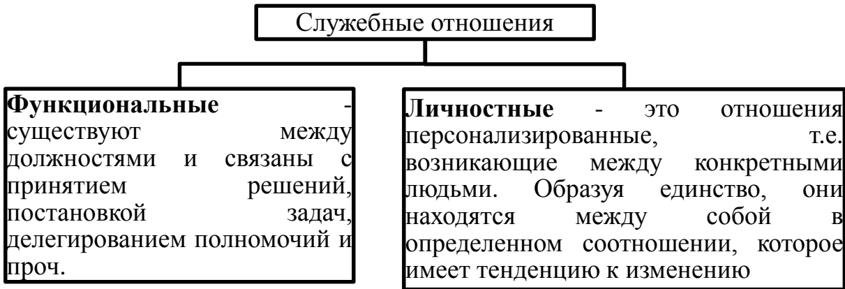
Рисунок 1. Факторы, влияющие на поведение подчиненных

Руководство включает в себя постановку задач, координацию, работу по созданию коллектива, мотивацию и основывается не только на официальных предписаниях, но и на личном примере и взаимном уважении. Нужно иметь в виду, что поведение людей (в данном случае подчиненных), бывает не только рациональным, но и иррациональным. На него влияют как объективные условия, воздействие руководителя, так и субъективные моменты, и прежде всего привычки и психологическое состояние (см. рис.1)