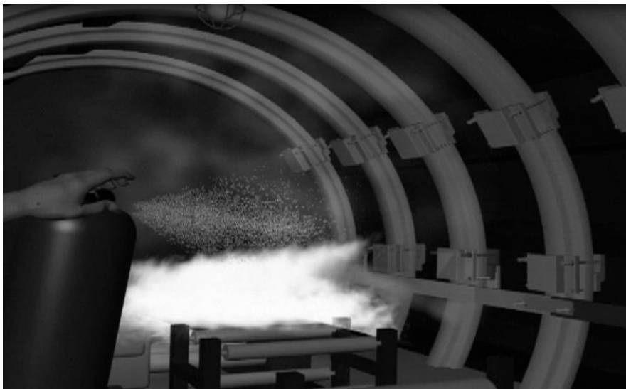
Рисунок 3 – Работа приложения