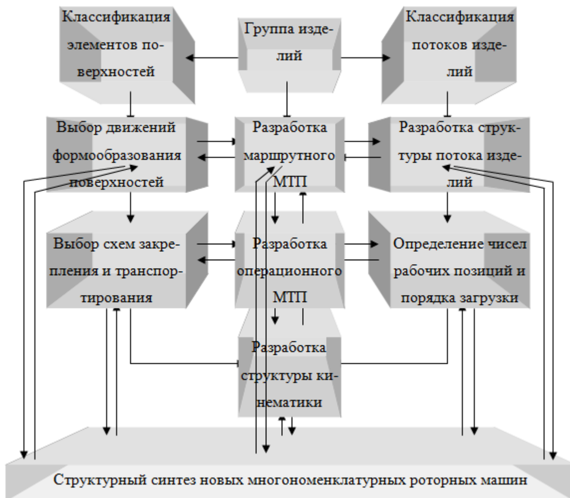
Рисунок 1 - Последовательность разработки многономенклатурных технологических процессов изготовления изделий.

многономенклатурных роторных систем следует совмещать с разработкой отношений между элементами многономенклатурных технологических процессов изготовления изделий.