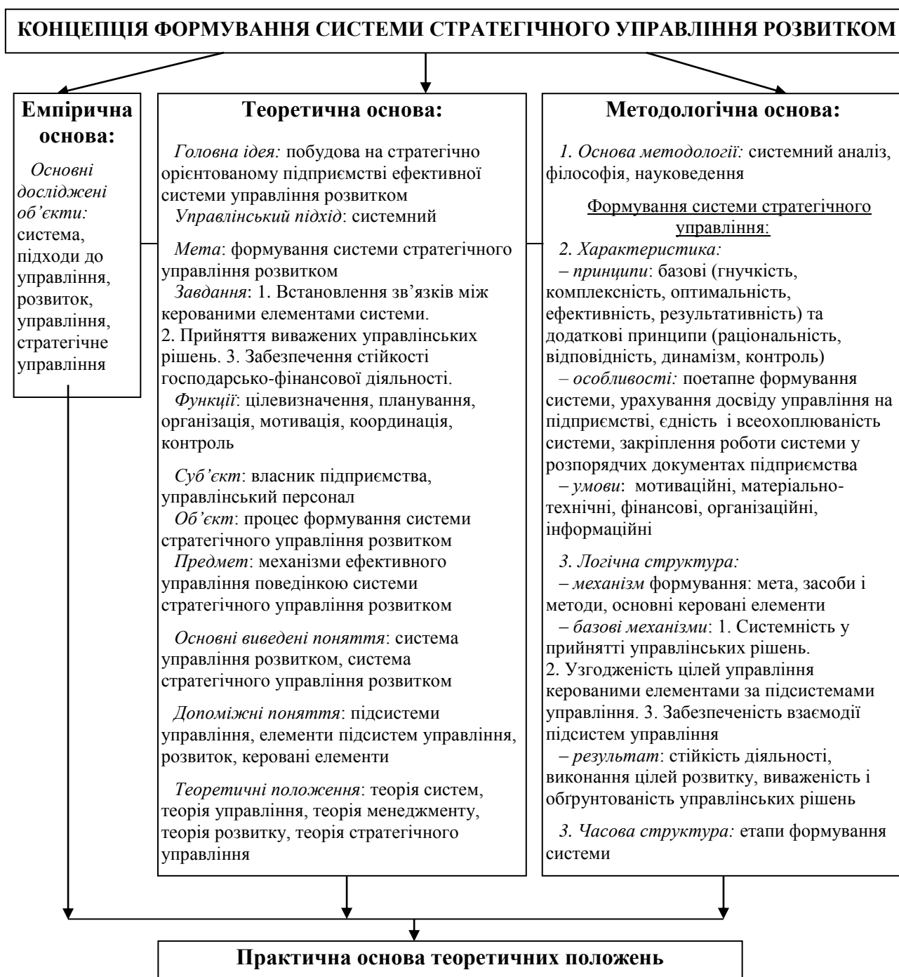
Рис. 1. Основні складові концепції формування системи стратегічного управління розвитком промислового підприємства.

Основними складовими концепції, які повинні закласти практичні підходи до розв'язання проблеми і створити практичну значущість теоретичних наукових тверджень, думок, є емпірична основа, теоретична основа і методологічна основа (рис. 1).