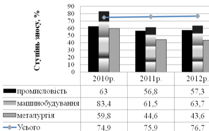
Рис. 1 – Динаміка ступеня зносу основних засобів підприємств України

Вже на протязі багатьох років на підприємствах України спостерігається обвальна тенденція до старіння основних фондів. Реальністю сьогодення є використання технічно відсталих, понаденергомістких технологій. Динаміку ступеня зносу основних засобів на підприємствах промисловості, підприємствах металургійного виробництва і машинобудування та у цілому за видами економічної діяльності представлено на рис. 1.