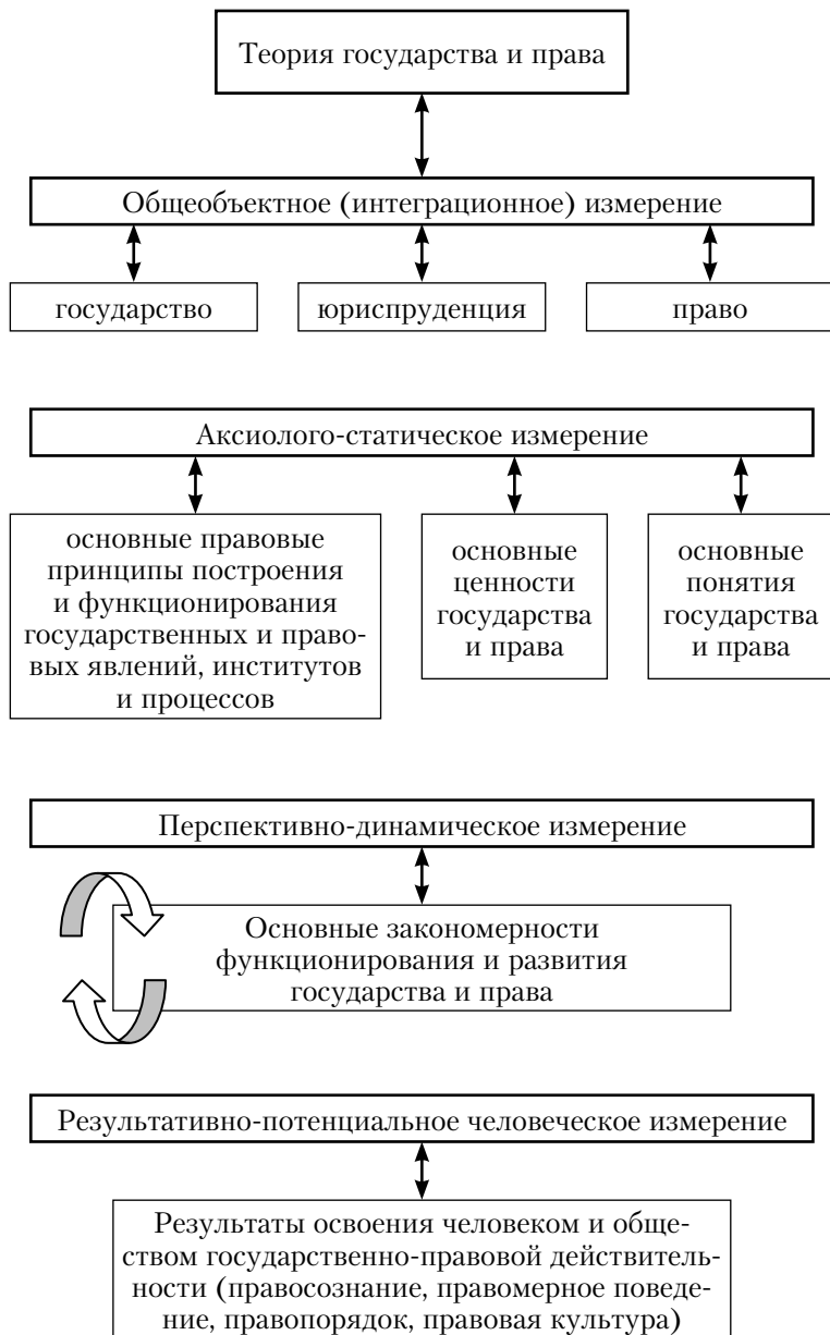
Рис. 1. Предмет теории государства и права