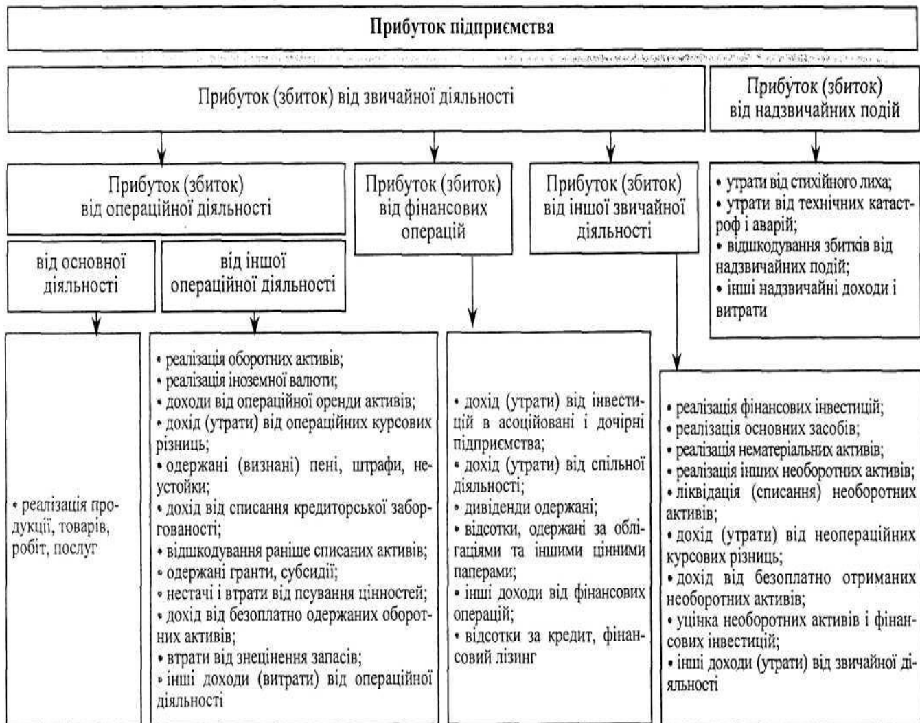
Рис. 4.1. Структурно-логіческая схема формирования прибыли предприятия в соответствии с П(С) Б У в Украине

Учет и определение финансовых результатов — прибыли (убытка) осуществляется по таким видам деятельности предприятия :