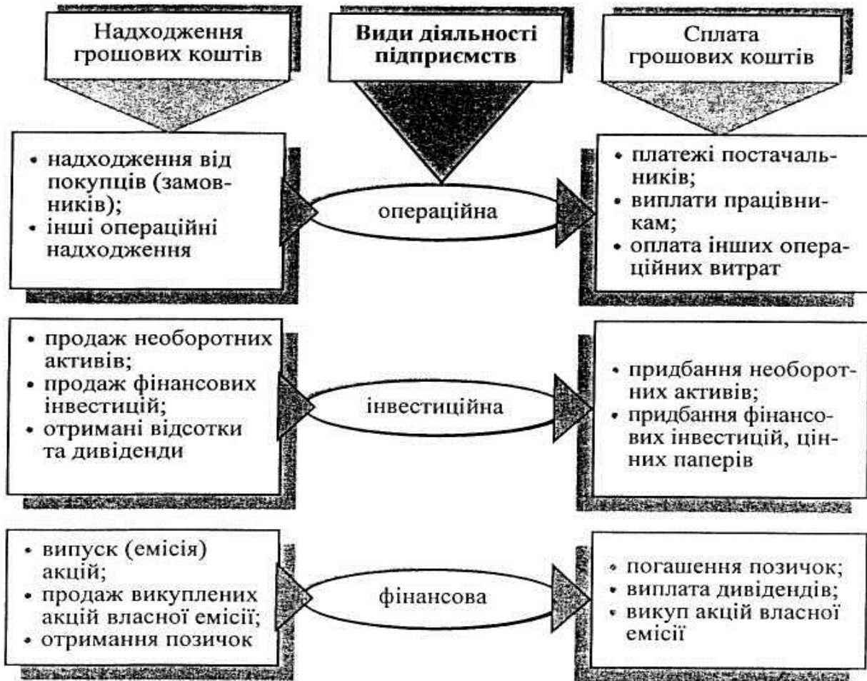
Рис. 4.1. Классификация денежных потоков по видам деятельности

Виды деятельности предприятия изображены на рис. 4.1.