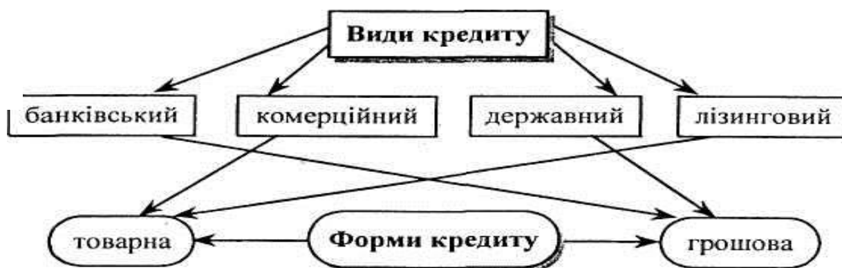
Рис. 9.1. Формы и виды кредитов, которые предоставляются предприятиям

Из рисунка видно, что кредиты бывают таких видов: