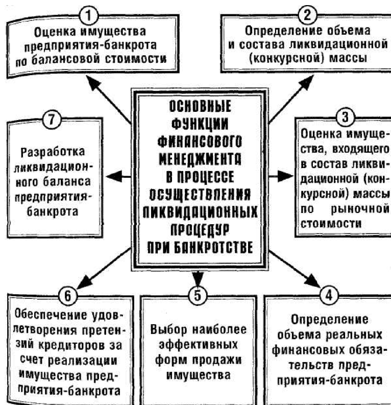
Рисунок 1 – Состав основных функций финансового менеджмента в процессе осуществления ликвидационных процедур при банкротстве.

1. Оценка имущества предприятия-банкрота по балансовой стоимости. Такая оценка осуществляется на основе полной инвентаризации имущества предприятия, принадлежащего ему на правах собственности или полного хозяйственного ведения. Инвентаризационные описи арендованных активов составляются отдельно по арендодателю с указанием, кроме установленных сведений, сроков и форм (видов) аренды. В инвентаризационную опись нематериальных активов должны быть внесены данные об их наименовании и характеристике, первоначальной стоимости и сумме амортизации, дате приобретения и сроке полезного использования.