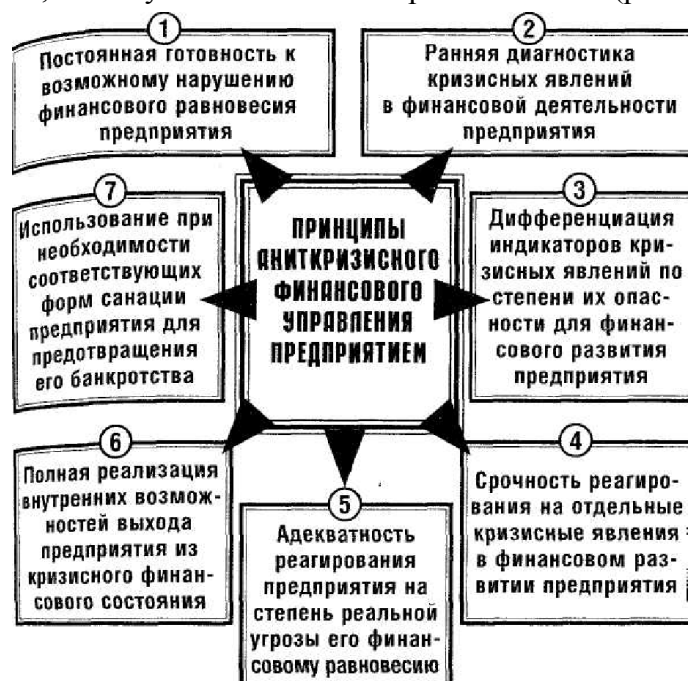
Рисунок 3 – Основные принципы антикризисного финансового управления предприятием

Рыночная экономика выработала обширную систему финансовых методов предварительной диагностики и возможной защиты предприятия от банкротства, которая получила название "системы антикризисного финансового управления". Для реализации этой системы управления в странах с развитой рыночной экономикой готовятся особые специалисты - менеджеры по антикризисному управлению компанией. Эта система базируется на определенных принципах, к числу основных из которых относятся (рис.3)