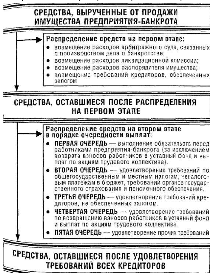
Рисунок 2 – Очередность распределения средств, вырученных от продажи имущества предприятия-банкрота

6. Обеспечение удовлетворения претензий кредиторов за счет имущества предприятия-банкрота. Это наиболее сложная и ответственная функция финансового менеджмента в процессе осуществления ликвидационных процедур при банкротстве. Источником обеспечения такого удовлетворения претензий являются средства, вырученные от продажи имущества предприятия-банкрота. Сумма этих средств распределяется в определенной очередности. Система очередности удовлетворения финансовых требований кредиторов при продаже имущества обанкротившегося предприятия приведена на рис. 2.