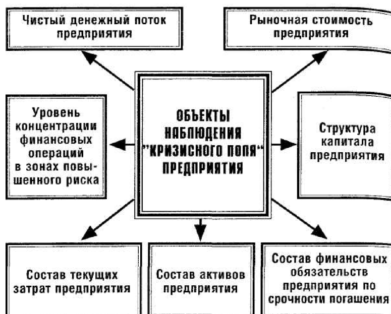
Рисунок 5 – Основные объекты наблюдения „кризисного поля“ предприятия, включаемые в систему мониторинга его текущей финансовой деятельности

2. Формирование системы индикаторов оценки угрозы банкротства предприятия. Система таких индикаторов формируется по каждому объекту наблюдения „кризисного поля“. В процессе формирования все показатели-индикаторы подразделяются на объемные (выражаемые абсолютной суммой) и структурные (выражаемые относительными показателями).