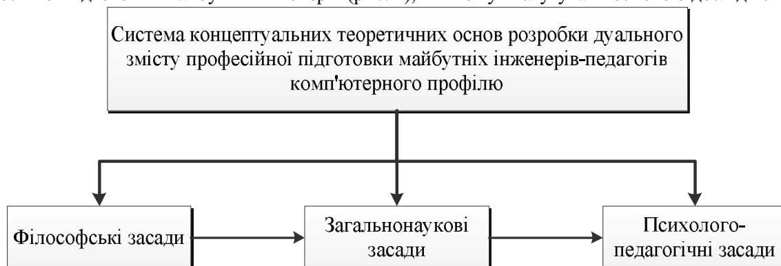
Рис. 1. Система концептуальних основ розробки теорії дуального змісту професійної підготовки майбутніх інженерів-педагогів

У роботі [4] виокремлено напрямки теоретичного обґрунтування та розробки змісту професійної підготовки майбутніх інженерів (рис. 1), які можуть слугувати основою дослідження.