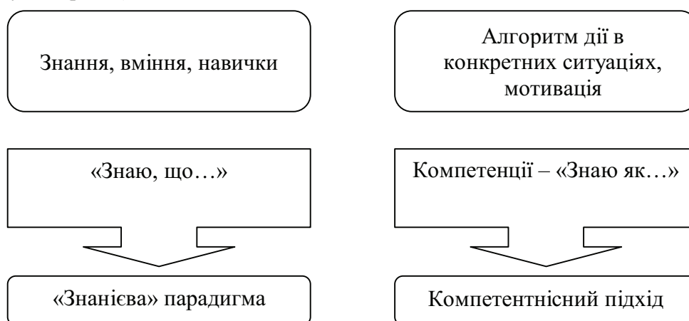
Рис. 1. Сутність поняття «компетенція»

«Компетенція (лат. відповідність, домірність) - коло повноважень якої-небудь установи чи особи; коло питань, у яких ця особа має знання, досвід». Сьогодні немає однозначного визначення поняття компетенція. Одні автори визначають її як готовність фахівця застосовувати на практиці отримані знання, інші – як здатність вирішувати проблеми, тобто компетенцію виражають за допомогою активних дієслів, які означають дію. Але багато дослідників погоджуються з тим, що компетенція ближче до понятійного поля «знаю, як», чим до поля «знаю, що». «Знаю, що» відноситься до атрибутів традиційної знанієвої парадигми, а «знаю, як» більше пов'язано зі «знаннями у дії» (рис. 1).