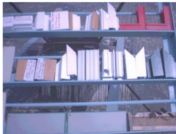
Рис.1. Определительные испытания фрагментов конструкций и их защитных покрытий для оценки коррозионной стойкости, долговечности и ремонтпригодности в условиях коррозионной станции

Испытываемые образцы располагают на стендах в свободном состоянии, причем способ их крепления обеспечивает возможность беспрепятственного изменения линейных размеров образца в процессе испытания (например, вследствие поглощения влаги). Форма и размер образцов для испытания на старение в естественных условиях определяются требованиями методик, предусматривающих последующий контроль заданных свойств, изменения которых по тем или иным соображениям принимаются в качестве основных.