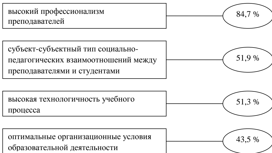
Рисунок 3 – Составляющие процесса образования

Социальный опрос среди студентов одного из ВУЗов Украины показал, что процесс образования, по их мнению, имеет такие составляющие (рис. 3) [6]: