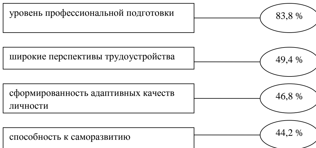
Рисунок 4 – Представления студентов о качестве результата образования в ВУЗе

В тоже время, представления студентов о качестве результата образования в ВУЗе выглядят следующим образом (рис. 4) [6]: