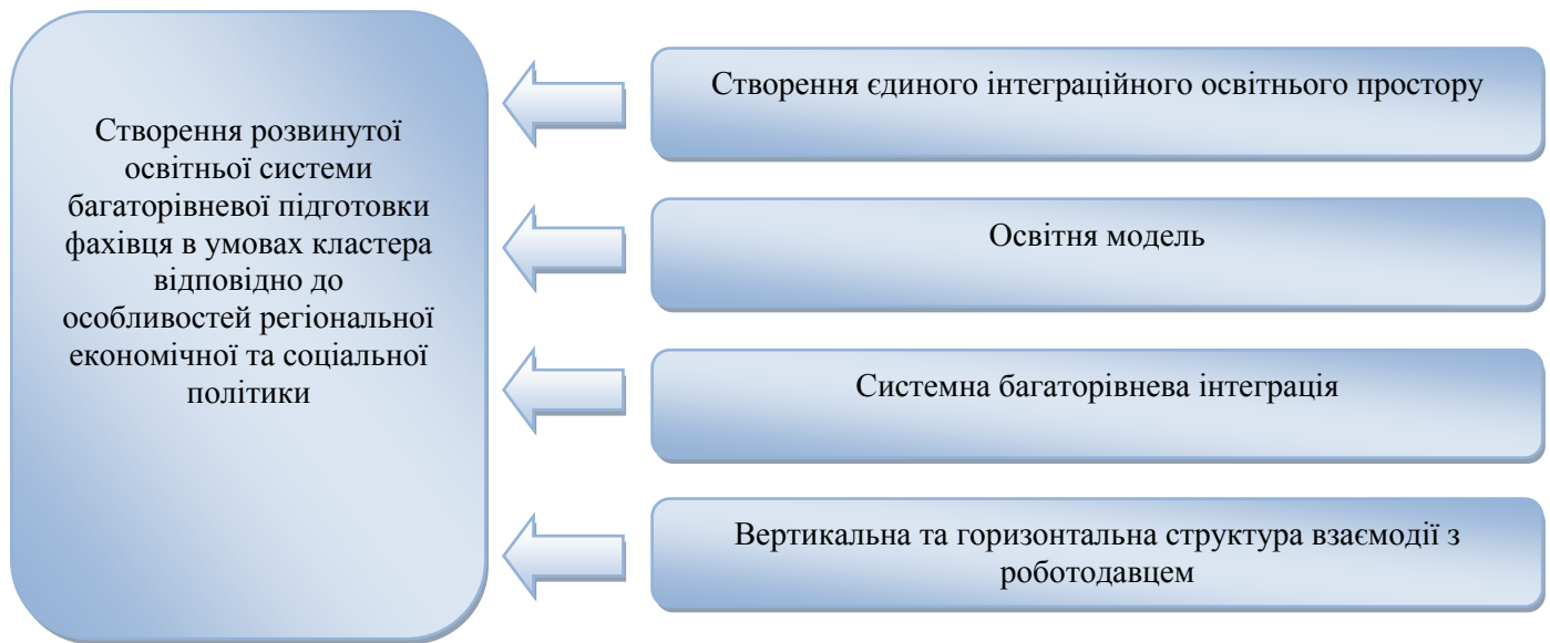
Рис. 1. Основні концептуальні положення освітнього кластеру

В загальному розумінні, освітня модель - це варіант практичної діяльності в освіті, який характеризує її практичне втілення. Серед моделей освіти, виходячи з ситуації, практики, можна виділити: